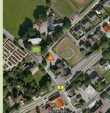
NÜTTERDEN, Antoniusweg 3 51°47'25.75"N 6°03'50.32"O