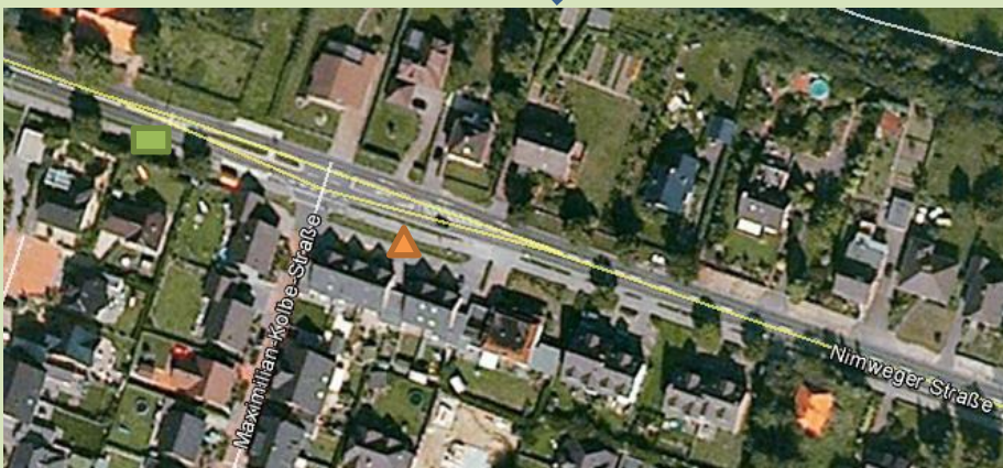
KRANENBURG Nimweger Straße/Maximilian-Kolbe-Straße, 51°47'31.62"N 5°59'54.21"O